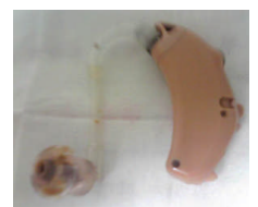
耳せんが汚れた例

今年は例年にない猛暑でしたので、直接肌に触れる耳かけ型補聴器は特に痛みが激しいかと思えます。ご自身で出来るメンテナンスについてご説明致します。ティッシュペーパーや洗浄綿で補聴器本体と電池フォルダーの中の汗を拭き取ります。耳せんやイヤモールドが汚れていたら、耳せんは本体同様ティッシュか洗浄綿で耳に入る部分と傘の内側、音の通り道の汚れを落とします。イヤモールドは本体から外して水洗いをお勧めします。以前は薄めた食器用の洗剤などに浸けて洗浄していましたが、アレルギー体質の人には良くないとの情報もありますので、真水で良いので使わなくなった歯ブラシなどでゴシゴシ洗って下さい。チューブや音の通り道はスポイトやエアプロアでシュブユブ水を行ったり来たりさせて汚れを落とします。その後水が音の道に残らない様ティッシュを紙縋りにして吸い取るかエアプロア等で空気を通して十分乾かして下さい。(補聴器本体は水濡れ厳禁です)おやすみになる時は乾燥ケースに入れておきましょう。